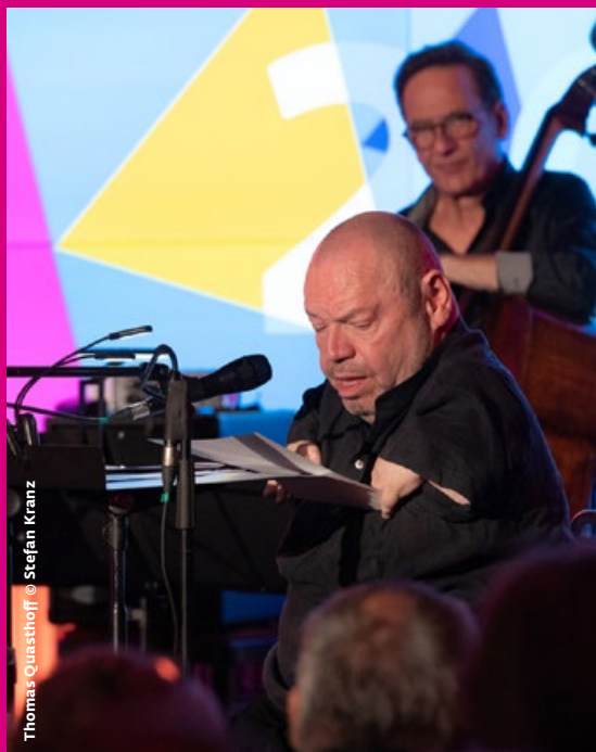
Thomas Quasthoff