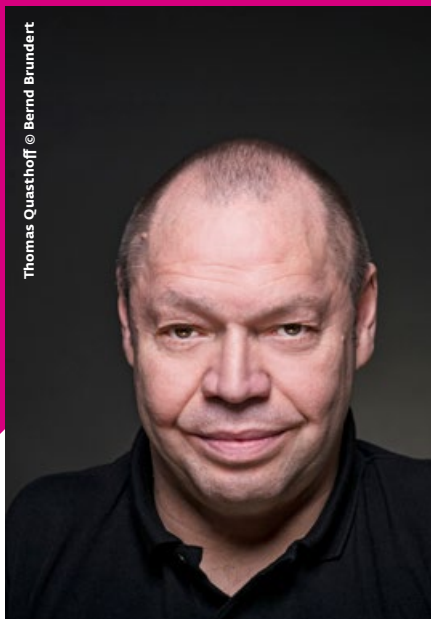
Thomas Quasthoff

Zum Abschluss der Woche präsentieren die jungen Künstlerinnen und Künstler in einem großen Abendkonzert, was sie in der Woche erarbeitet haben.