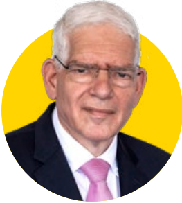
Dr. Josef Schuster Präsident des Zentralrats der Juden in Deutschland, Schirmherr der ACHAVA Festspiele Thüringen

Bereits zum zwölften Mal setzen die ACHAVA Festspiele in Thüringen ein unverzichtbares Zeichen. Das hebräische Wort „Achava“ bedeutet Brüderlichkeit. Genau dieses Konzept steht heute jedoch massiv unter Druck.