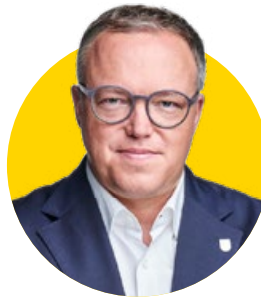
Mario Voigt Thüringer Ministerpräsident, Schirmherr der ACHAVA Festspiele Thüringen 2026

In diesem Sinne laden wir ein, jüdisches Leben in Thüringen kennenzulernen, Zeitzeugen zu treffen, Konzerte und Ausstellungen zu genießen und daraus Begeisterung, Neugier und Hilfsbereitschaft mit heimzunehmen.