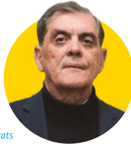
Romani Rose Vorsitzender des Zentralrats Deutscher Sinti und Roma, Schirmherr der ACHAVA Festspiele Thüringen

Die ACHAVA Festspiele wirken dem Hass aktiv entgegen. Mit ihrem Fokus auf kulturelle Vielfalt eröffnen sie einen Raum für Austausch und das gegenseitige Kennenlernen. Dass die Festspiele dabei durch Begegnungen mit Zeitzeugen oder in der neu erfahrbaren Sendehalle Weimar stark auf das Bildungsprogramm setzen, stimmt mich überaus zuversichtlich. Ich bin erfreut, Schirmherr dieser 12. ACHAVA Festspiele zu sein und danke allen, die hier laut und sichtbar für jüdisches Leben eintreten.