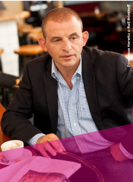
Dominique Horwitz

Die drei Künstler wollen sich gemeinsam auf eine musikalische Spurensuche an einem spannenden Ort machen. Der große Sendesaal des ehemaligen Funkhauses steht als wichtiges Musik- und Sendestudio von 1947 bis 1992 für Rundfunk- und Musikgeschichte im Osten der Republik.