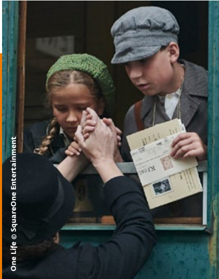
One Life