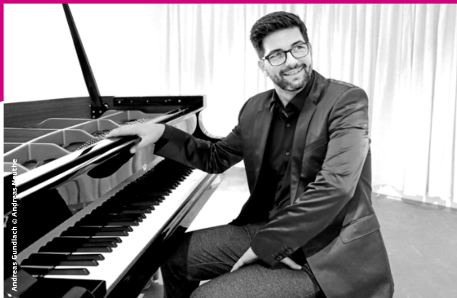
Andreas Gundlach